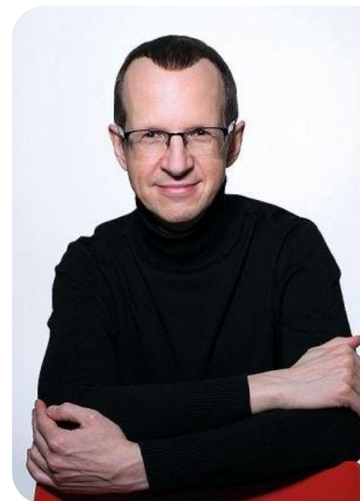
CD «Latviešu klaviermūzikas antoloģija» Klavieres Juris Žvikovs 2005.g.