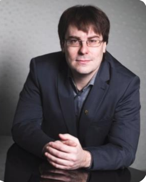
CD "Kalniņš Alfrēds "Moments Musicaux« Klavieres Toms Ostrovskis 2018.g.