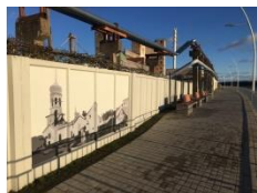
4. Gajoka promenade