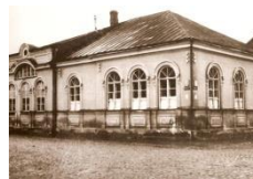
7. Daugavpils sinagoga – Kadiša lūgšanu nams