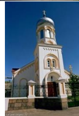
6. Gajoka (Gaiķu) vec ticībnieku lūgšanu nams