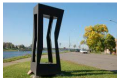
3. Piemiņas zīme "Veltījums Rotko"