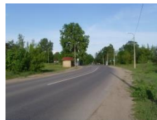
5. Oskara Stroka dzimtā māja