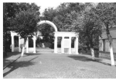
1. Dubrovina parks