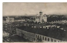
8. Svētā Nevas Aleksandra katedrāle